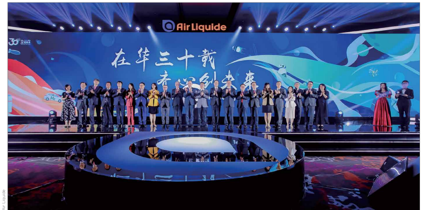
Célébration des 30 ans d'Air Liquide en Chine

« Aujourd'hui la filiale Air Liquide Chine, après un peu plus de 30 ans de développement, représente 10% du chiffre d'affaires du groupe au niveau mondial et sa contribution va au-delà de l'aspect financier. »