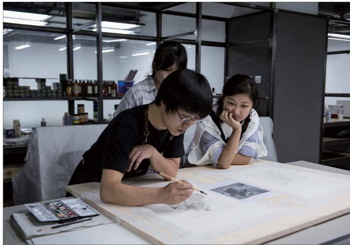
CHAO Sanlitun Beijing