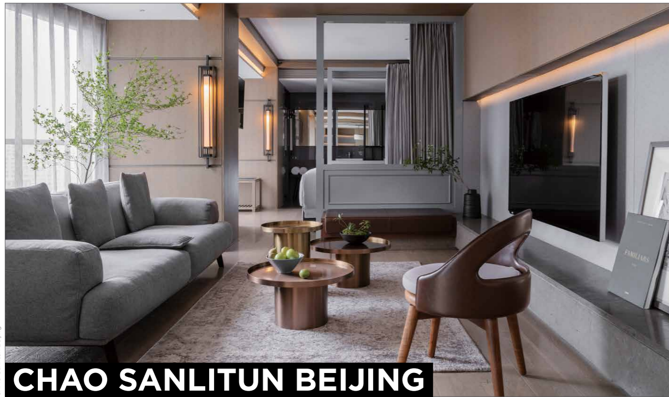
CHAO Sanlitun Beijing