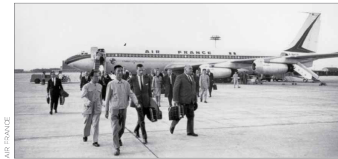
Arrivée du premier vol d'Air France, à l'aéroport de Shanghai (Hong Qiao), le 20 septembre 1966 1966年9月20日第一架法航客机降落在上海虹桥机场