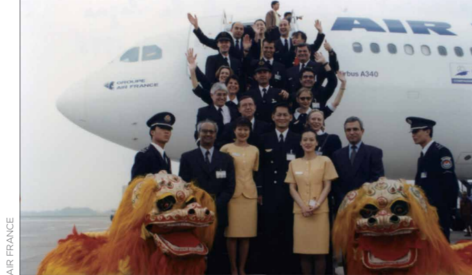
Réouverture de la ligne Paris-Shanghai en 1998 巴黎-上海航线于1998年重新开通