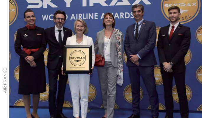
Air France a été récompensée à de multiples reprises aux Skytrax 2023年法国航空在Skytrax全球航空大奖中屡获殊荣