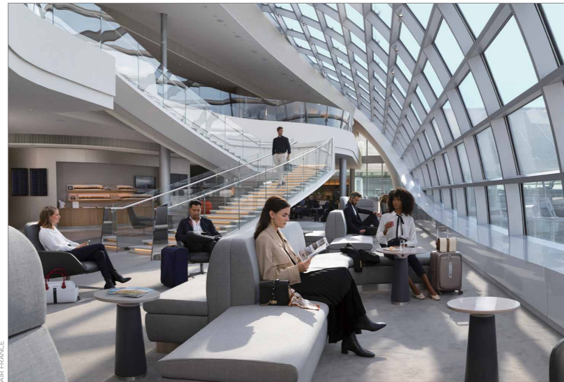
Le salon d'Air France à l'aéroport Paris-Charles de Gaulle, Terminal 2 巴黎戴高乐机场2号航站楼法航休息室

issus de la pêche durable au départ de Paris. Par ailleurs, dans toutes les cabines de voyage, des menus végétariens sont systématiquement proposés sur tous les vols de la compagnie.