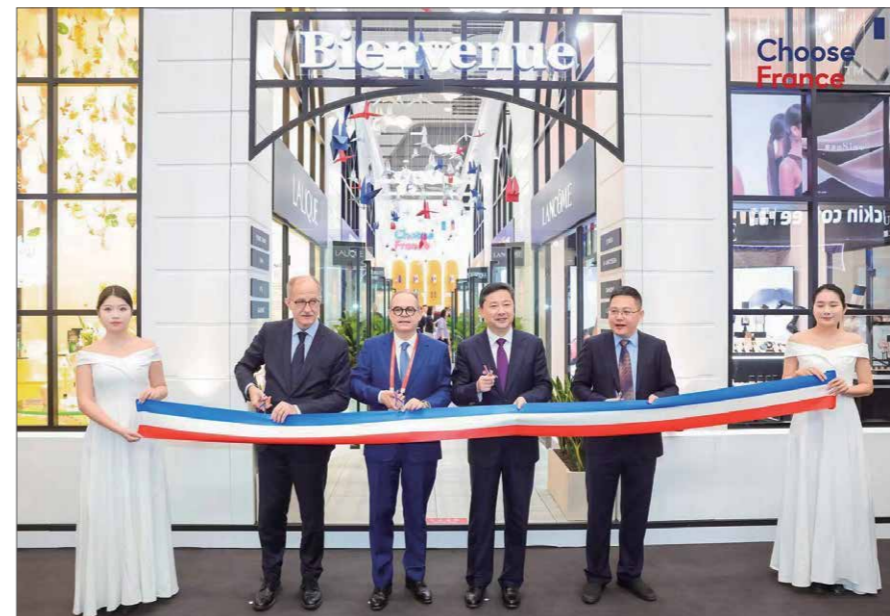
L'attractivité de la France est mise à l'honneur également sur les pavillons qui promeuvent les marques françaises sur les grandes expositions en Chine, à l'exemple de la foire des biens de consommation à Hainan en avril 2024. 法国的吸引力还体现在中国的大型展览会上对法国品牌的宣传推广，如2024年4月在海南举行的中国国际消费品博览会上的法国馆。