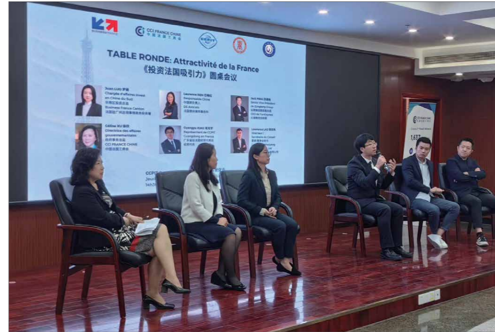
Table Ronde : Attractivité de la France, le 27 avril 2023 à Canton 2023年4月27日在广州举办“投资法国吸引力”圆桌会议