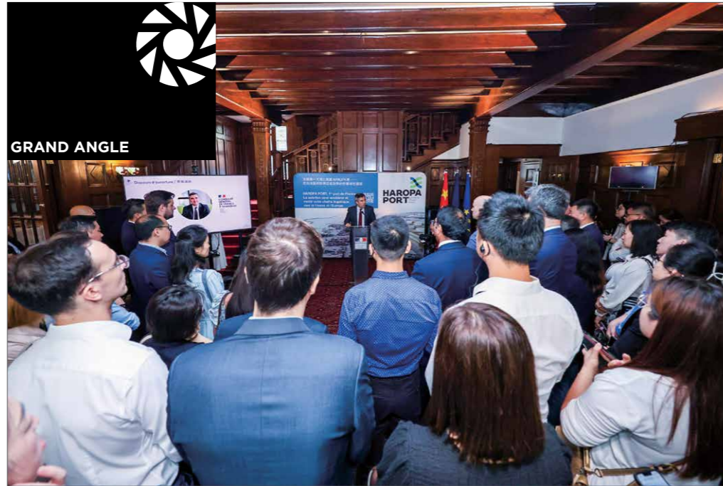
L'évènement de promotion HAROPA qui s'est tenu à la résidence de France à Shanghai (villa Basset) le 28 juin 2024 HAROPA推广活动于2024年6月28日在法国驻上海总领事官邸巴赛别墅(Villa Basset)举行

Directeur de la zone Chine Business France